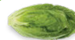
SALÁT ŘÍMSKÝ CRUNCHITA