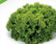
SALÁT LISTOVÝ LANDAU