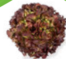
SALÁT DUBÁČEK COUSTEAU