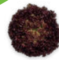
SALÁT LISTOVÝ CARMESI